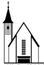
Zur Hl. Dreifaltigkeit