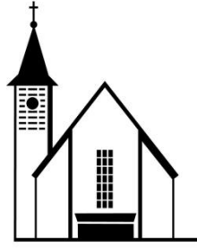
Zur Hl. Dreifaltigkeit