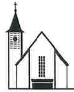
Zur Hl. Dreifaltigkeit